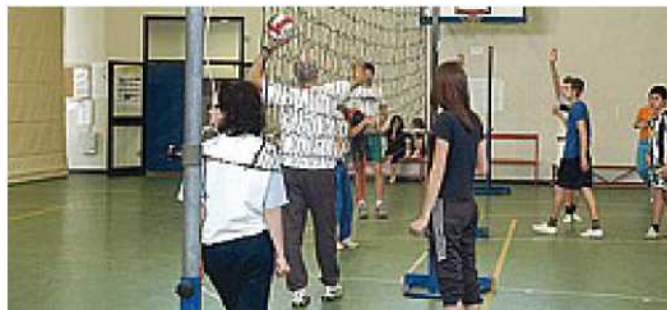
La palestra dell'Istituto Pacioli di Crema, tra i nuovi licei sportivi